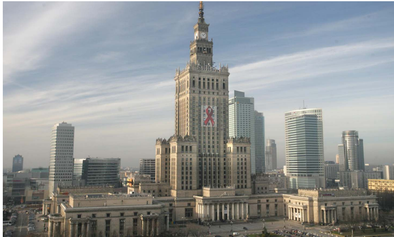
The Palace of Science and Culture in Warsaw decorated with the red ribbon 27.11 - 4.12.2009