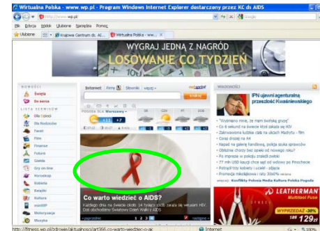
The International AIDS Day 2009 in media